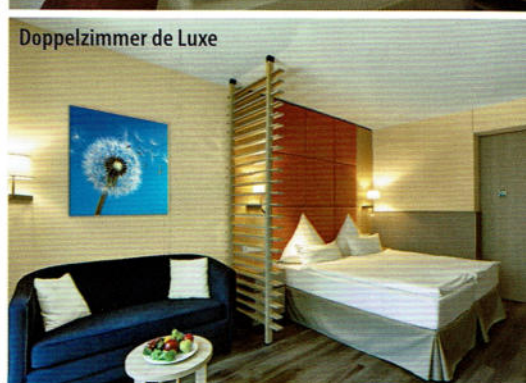
Doppelzimmer de Luxe